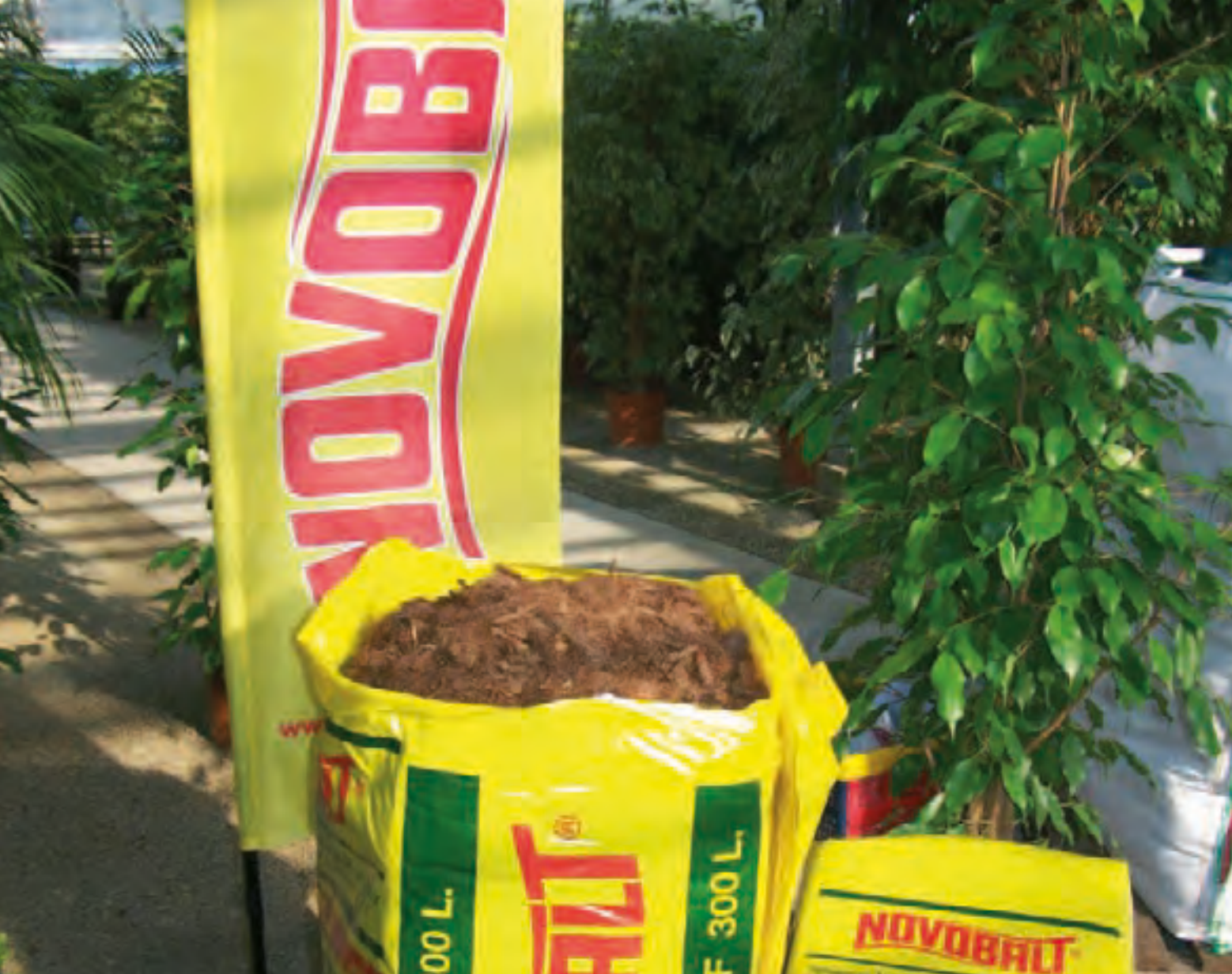
Turf - Tourbe