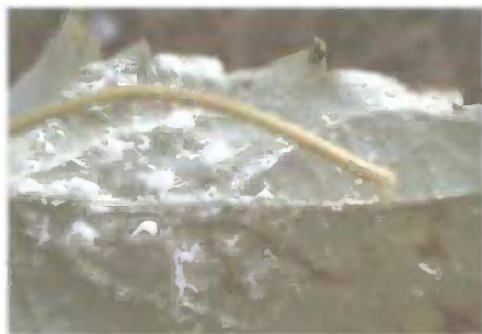
Slika 7. Ličinke na listu kupine

Obilno izlučivanje medne rose koja kao hranidbeni atraktant predstavlja i hranu velikog broja insekata (mrava, voćnih muha, bubamara) dovelo je do povećane brojnosti ovih vrsta u vrtovima koji istina ne prenose bolesti i ne predstavljaju javnozdravstveni problem, ali svojim molestirajućim učinkom značajno smanjuju kvalitetu življenja u infestiranim područjima. Na izlučenu mednu rosu naselile su se gljive čađavice, smanjujući vrijednost ploda, koji se zbog prljavog izgleda i gadjivosti nije mogao koristiti za prehranu.