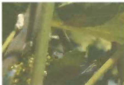
Slika 10. Odrasli oblici na vinovoj lozi

Zbog bogate vegetacije, velikog broja drveća, omogućeno je polaganje jaja u pukotine i pupove biljaka što će pogodovati prezimljavanju ove vrste, a time i ponovnim problemima u proljeće kada započinje presvlačenje ličinki i konačno ponovna pojava odraslih oblika u ljetnim mjesecima.