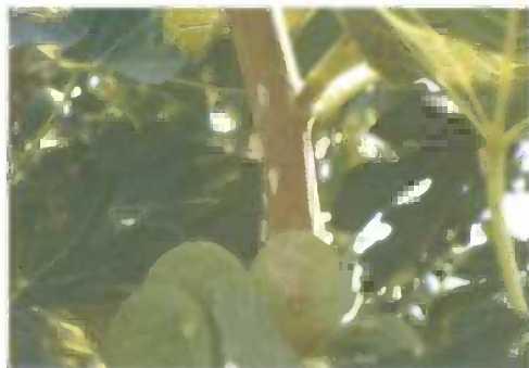
Slika 9. Odrasli oblici na smokvi

Izlučivanjem velikih količina medne rose cijela dvorišta su poprimila ljepljiv i prljav izgled, a zbog njenog curenja s brajdi onečišćene su terase, dvorišta, vrtne garniture itd. Nije se moglo odmarati u hladu infestiranih brajdi zbog curenja medne rose po stolovima i vrtnom namještaju. U Privlaci su česti vinogradi smješteni u neposrednoj blizini kuća pretrpjeli velike štete zbog napada ovog kukca.