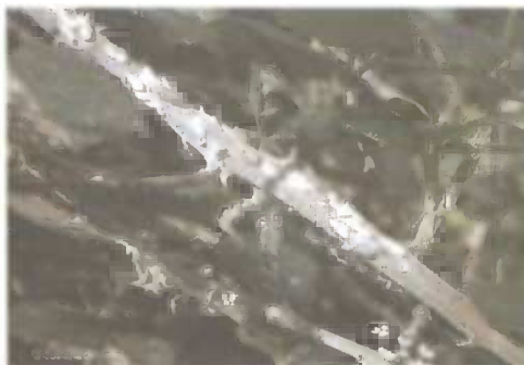
Slika 8. Ličinke na stabljici kupine