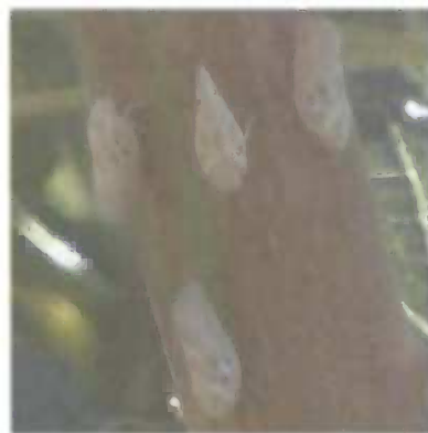
Slika 6. Nakupine Metcalfa pruinosa u mirovanju