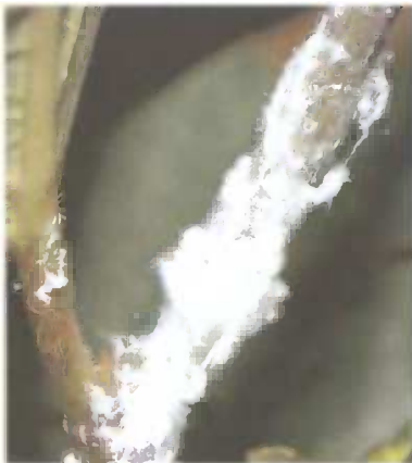
Slika 5. Voštane nakupine

Ova vrsta je izraziti polifag, napada više od 200 biljaka domaćina i možemo je naći na vinovoj lozi, smokvi, jabuci, breskvi, duđu, kupini, ružama, mandarinama, cvijeću itd. Na biljci se često nalaze u velikim skupinama, poredani u nizu jedan iza drugoga te su im prilikom mirovanja krila položena okomito uz tijelo (slika 6). (16)