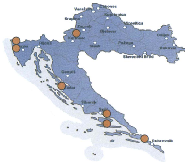
Slika 2. Nalazišta Metcalfa pruinosa u Hrvatskoj

Pojavnost medećeg cvrčka u Hrvatskoj zabilježena je prvi put 1993. godine u Istri, okolica Buja (Maceljski, 1995). Već nekoliko godina kasnije bilježe se velike štete na maslinama, vinovoj lozi, hrastu, glogu i ostalom bilju u okolici Poreča. U Dalmaciji na otoku Hvaru, u blizini Vrgorca i u Dubrovniku bilježi se prisustvo vrste 2005. i 2006. godine (slika 2). Vrsta je pronađena i na području grada Zagreba. (7)