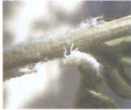
Slika 4. Ličinka Metcalfa pruinosa

Ličinke se presvlače pet puta, a ličinke posljednja dva stadija mogu skakati. Hrane se sišući sokove na granama, lišću i mladim izbojcima biljaka. Tijekom ishrane luče bjelkastu voštanu tvorevinu kojom prekrivaju napadnute dijelove biljke (slika 5). Razvoj ličinki traje oko dva mjeseca. Odrasli oblici se počinju pojavljivati u srpnju, a nalazimo ih do sredine rujna. Do kopulacije dolazi tijekom umjereno vlažnih noći. Ženka pomoću leglice pojedinačno ili u nizu jaja odlaže u pupove, pukotine ili na druga mjesta na kori čokota ili drveća. Odlaze oko 60 oplođenih jaja, a polaganje jaja započinje već u kolovozu. (11)