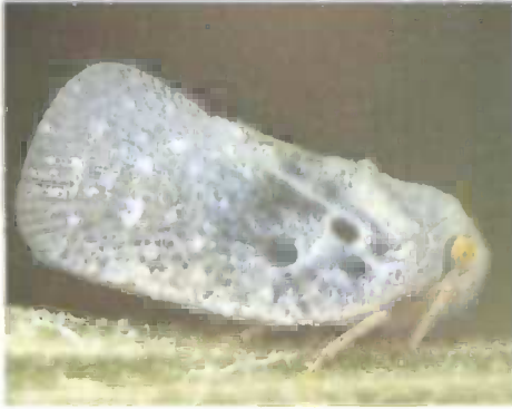
Slika 3. Odrasla jedinka Metcalfa pruinosa